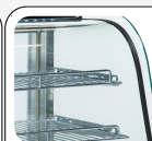
Doppio vetro anti-dispersione