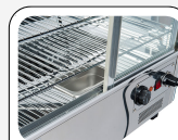
Basamento in acciaio inox